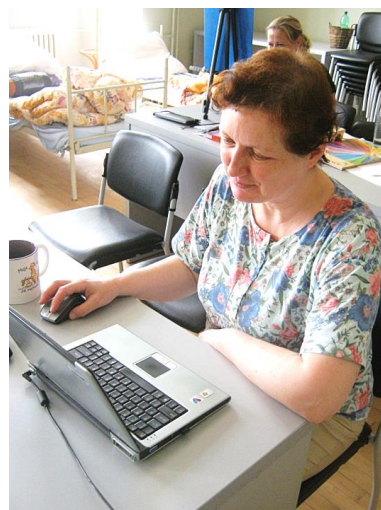
Ilustrační foto nemající vztah k žádné konkrétní osobě.

Věříme, že naše omluva a důsledné popření předchozích nepravd dojde milosti v očích Vierky i soudní mašinerie české, slovenské a evropskounijní.