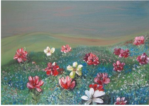
František Evžen K.: Louka